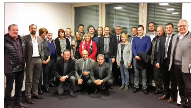
«Definire insieme il futuro»: incontro presso la Rubner spa di Chienes per imprenditori e politici pusteresi