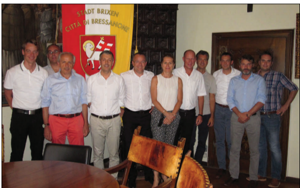
Gli imprenditori della Valle Isarco vengono accolti in Comune a Bressanone

In Val Venosta gli imprenditori hanno fatto visita ai comuni di Laces, Silandro, Prato e Castebello per affrontare con sindaci e assessori comunali tematiche che interessano trasversalmente tutta la vallata: la copertura a banda larga di tutto il territorio, la viabilità e i progetti infrastrutturali, tra cui spiccano le circonvallazioni, nonché le aree di insediamento per nuove aziende. Il ciclo di incontri venostani si concluderà a breve con la visita al Comune di Lasa.