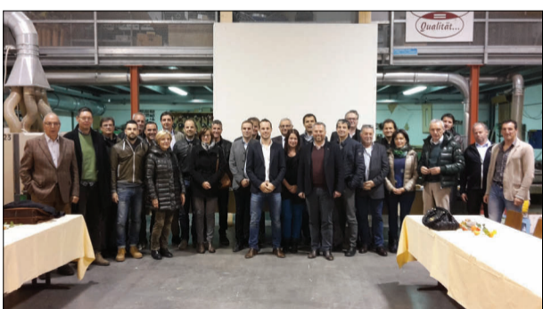
Imprenditori e amministratori comunali della Val Pusteria riuniti presso la Kargruber&amp;Stoll srl a Monguefello