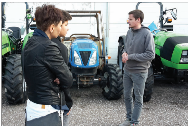
LOCHMANN SRL come nasce una cabina per trattori