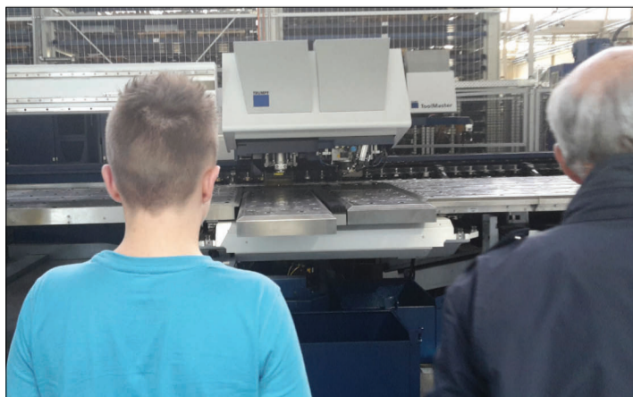
RIZZOLI SRL il fascino dei macchinari