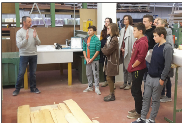
HÖLLER SAS un futuro tra gli arredi di alta qualità