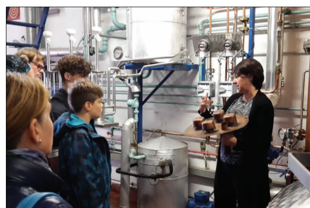
RONER SPA un viaggio nella distillazione