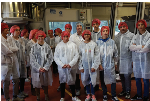
PAN SURGELATI SRL attenzione all'igiene nell'industria alimentare