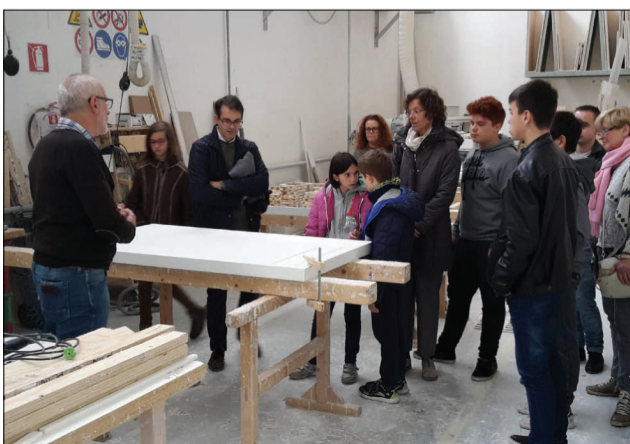
PLANIT SRL imparare a lavorare materiali speciali

Con circa 110 partecipanti tra ragazzi, insegnanti e genitori per un totale di complessivamente circa 190 visite a undici aziende associate si è conclusa anche la seconda edizione dell'Open day della Bassa Atesina che Assoimprenditori Alto Adige ha organizzato il 21 e 22 ottobre scorsi. Per due mezze giornate le aziende hanno aperto le porte alle scuole medie di lingua italiana e tedesca di Laives, Egna, Termeno e Salorno per far conoscere anche ai più giovani le molteplici opportunità professionali che offrono le aziende organizzate a livello industriale.