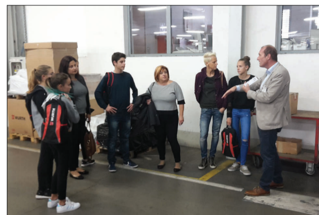
WÜRTH SRL l'organizzazione del magazzino