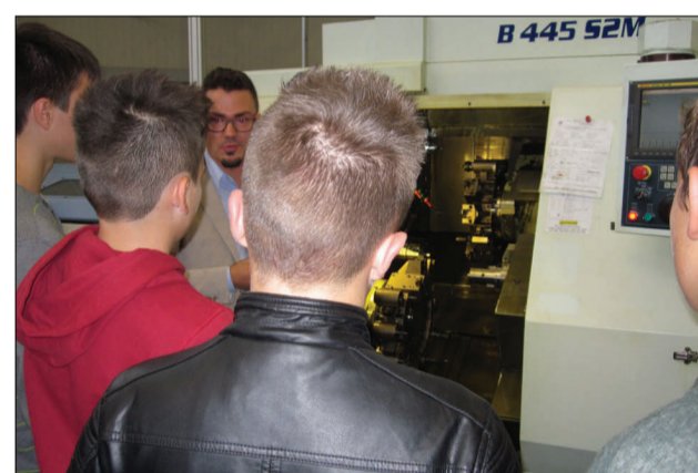
VAP SRL tornire e fresare su macchine a CN