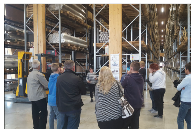
ROTHOBLAAS SRL l'importanza della logistica