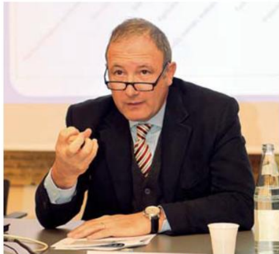
Orgoglioso Il presidente Pan illustra i dati dell'industria altoatesina