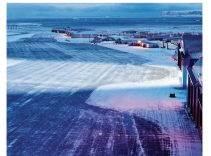
THULE AIR BASE, Groenlandia

L'elemento centrale dei sistemi di illuminazione e della tecnologia modulare dell'azienda è