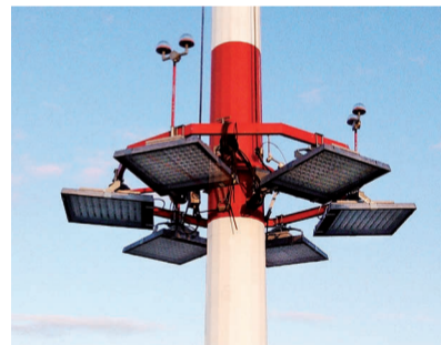
AEROPORTO YAKUTSK, Siberia

Soluzioni illuminotecniche d'avanguardia per il grande freddo