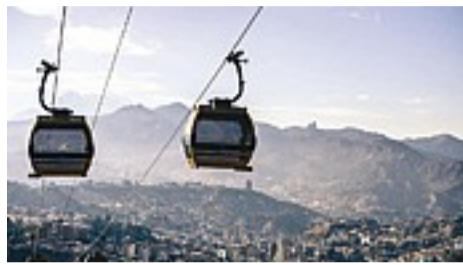
DOPPELMAYR IN COLOMBIA a Bogotá una cabinovia ad ammassamento automatico

Prosegue con successo l'impegno sui mercati internazionali della Doppelmayr Srl. Prima dell'estate è stata posata la prima pietra per la fase II della più grande rete funiviaria urbana del mondo che è in fase di realizzazione a La Paz - El Alto in Bolivia. La Línea Azul (Blu) è la prima di un totale di sei nuove linee in programma per la fase II. E' previsto che la linea entri in funzione assieme alla Línea Blanca (Bianca) già nel 2017. Nelle scorse settimane l'azienda funiviaria si è già aggiudicata un altro importante appalto. Si tratta della realizzazione di un progetto funiviario urbano nella capitale della Colombia, Bogotá. La funivia - una cabinovia ad