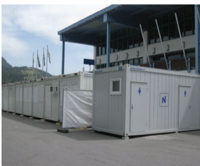
VERSATILI E ADATTABILI A DIVERSE ESIGENZE i container di Niederstätter al G7 di Garmisch - Partenkirchen.

Oltre 80 strutture per utilizzo tecnico e amministrativo. Un'esperienza testata durante il terremoto dell'Emilia