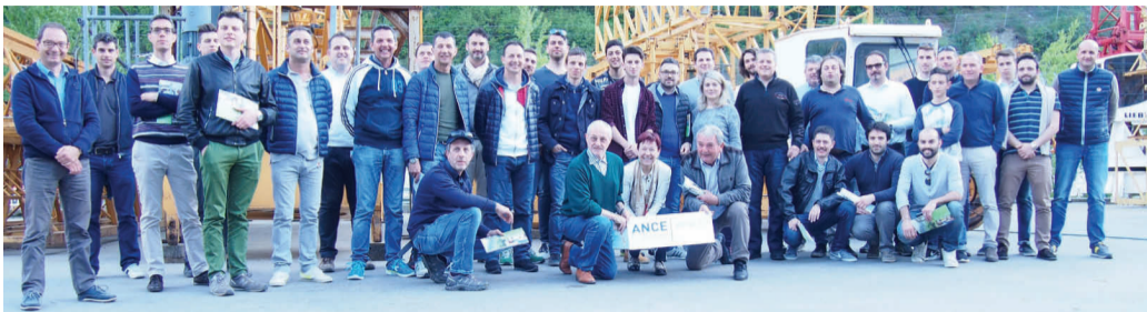
GIOVANI COSTRUTTORI VENETI E NIEDERSTÄTTER un impegno comune

Già da qualche tempo il gruppo Ance Veneto giovani è impegnato nella lotta contro la concorrenza a basso prezzo e poco qualificata. In tale contesto si inquadra la serie di eventi "Ciclo del bello", una serie di conferenze organizzate nelle "Ville Venete" con l'obiettivo di informare i costruttori che incaricare un'impresa seria, alla fine, ripaga sempre. Condividendo tale obiettivo, la Niederstätter spa ha sostenuto l'iniziativa ed invitato i giovani imprenditori di Ance Veneto che a metà aprile sono rimasti in Alto Adige per due giorni. I giovani costruttori hanno visitato un cantiere nei pressi di Bressanone e il centro