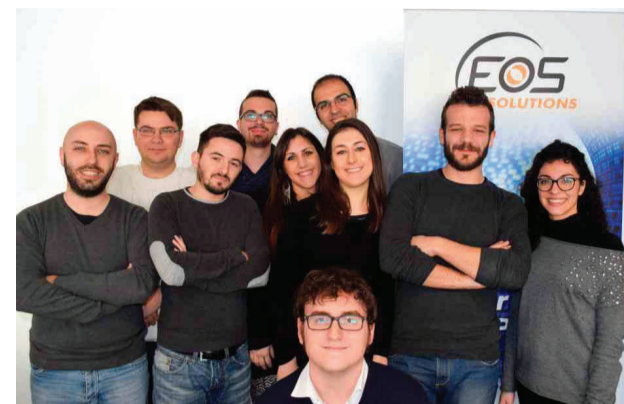
TEORIA E PRATICA CON EOS ACADEMY formazione di neolaureati

Dal primo marzo dieci neolaureati in economia o informatica stanno frequentando un programma di formazione di sei mesi promosso da Eos Solutions spa di Bolzano che offre poi loro la possibilità di essere assunti come consulenti o programmatori Erp. Si tratta della seconda edizione di tale programma suddiviso in tre fasi che l'azienda associata ad Assoimprenditori Alto Adige propone a giovani laureati che hanno così l'opportunità di acquisire le conoscenze professionali necessarie per la gestione e lo sviluppo di progetti Erp, nonché raccogliere le prime esperienze sul campo. Appena completata la formazione in aula, i giovani possono poi svolgere uno stage ed essere inseriti nelle varie strutture di Eos a Bolzano, Milano, Bologna e Padova, gettando così uno sguardo nell'attività di un po' tutta l'organizzazione. Dal 2.000 Eos Solutions è attiva con i propri servizi di software Erp sul mercato italiano ed austriaco