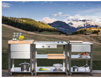
MEDAGLIA D'ORO A COLONIA Cunkitchen" di Jokodomus

Con 215 espositori fra i più importanti brand legati al mondo della cucina e 146mila visitatori la fiera specializzata LivingKitchen, che si è svolta in gennaio a Colonia, si è consolidata anche nel 2015 quale appuntamento da non perdere per il settore della cucina. A Colonia era presente anche Jokodomus, che ha presentato le sue novità di moduli cucina e stazioni di cottura. E proprio per la sua cucina modulare "Cunkitchen" l'azienda associata ad Assoimprenditori Alto Adige ha vinto la medaglia d'oro nella sezione "newcomer" assegnata dal blog designlines.de durante la fiera Living Kitchen a Colonia 2015. Studiata per l'esterno, ma