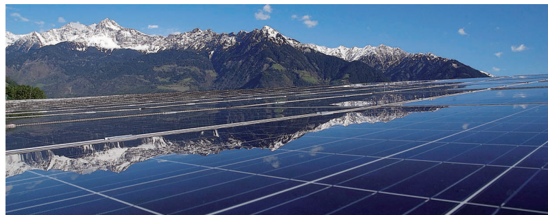
UN IMPIANTO FOTOVOLTAICO

La “Giornata delle imprese” ha luogo venerdì, 23 settembre 2011, con inizio alle ore 10.30, al Centro congressi Hotel Four Points by Sheraton di Bolzano. La manifestazione nell'ambito della Fiera specializzata “Klimaenergy” è organizzata da Assoimprenditori Alto Adige, con il sostegno della Cassa di risparmio di Bolzano e in collaborazione con le aziende associate Azienda Energetica Spa e Sel Spa. La “Giornata delle imprese” è aperta a tutti gli interessati e si conclude con un rinfresco per tutti i partecipanti, che riceveranno anche un biglietto d'ingresso per la Fiera Klimaenergy, dedicata all'utilizzo commer-